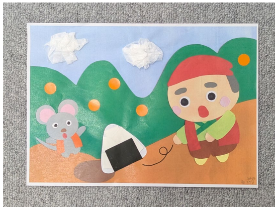
令和7年11月 「おむすびころりん」