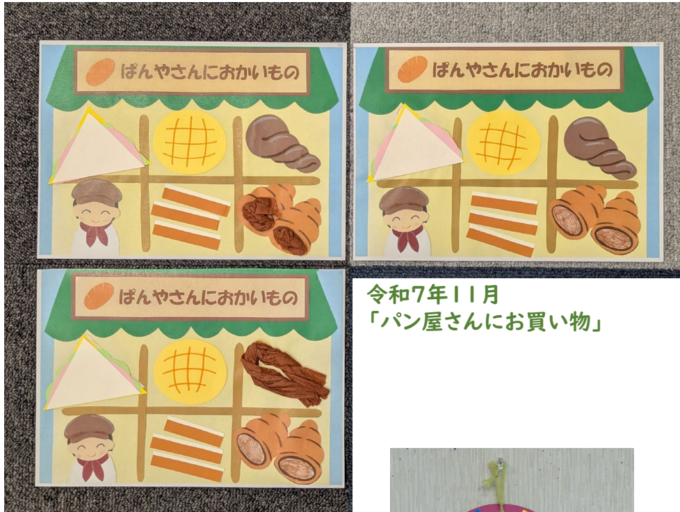
令和7年11月 「パン屋さんにお買い物」