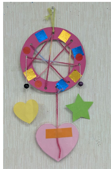
令和8年3月 「ドリームキャッチャー」